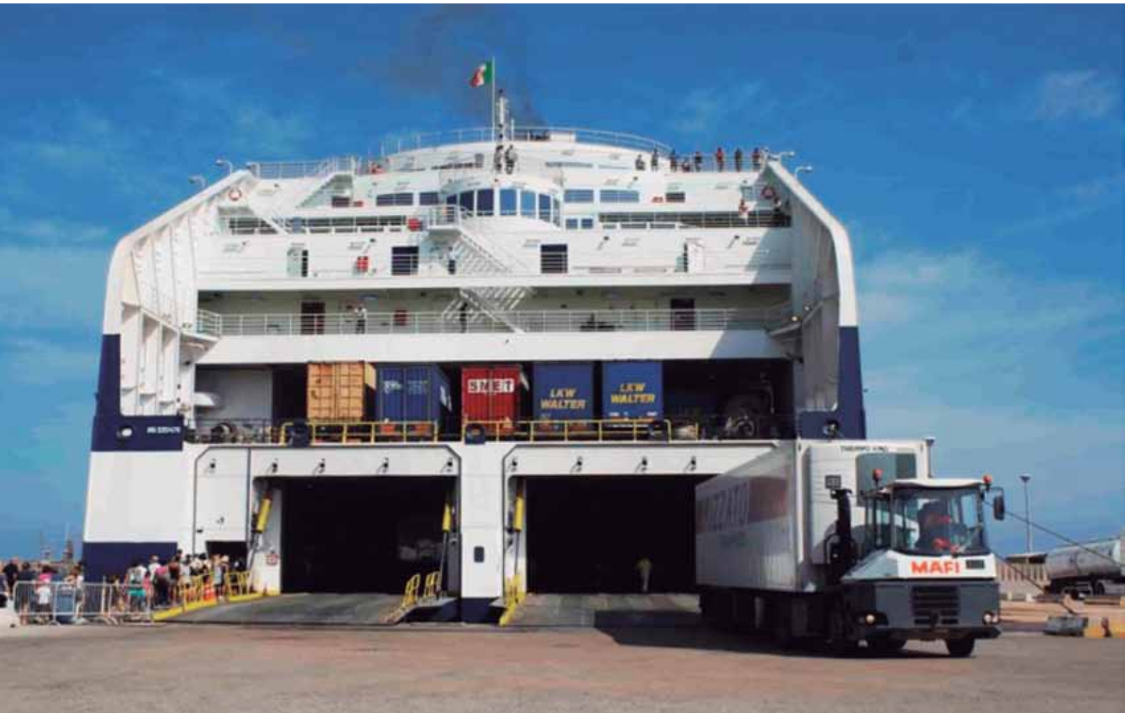
Imagen: Buque Ro-Ro dedicado al Short Sea Shipping: Tomado de: http://www.naucher.com/es/actualidad/las-claves-del-short-sea-shipping-desgranados-en-la-conferencia-europea-de-barcelona/_n:5379/

2. Funcionales: Presenta dificultades en la coordinación con el servicio portuario y el transporte por carretera, la oferta es más rígida y la fiabilidad se reduce por causas meteorológicas y por la lentitud de la vía marítima.